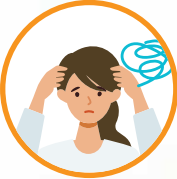
विचारांचा गोंधळ उडतो