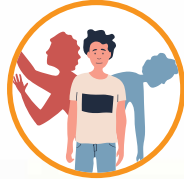
वागणूक असामान्य असते